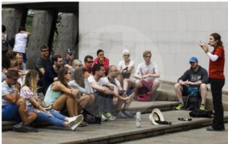
Turistas con su guía en el sector de La Alpujarra, Centro de Medellín.